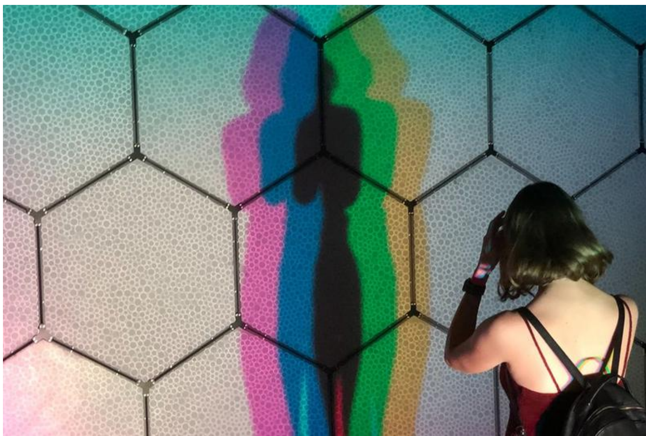
Un museo digitale (foto simbolica)