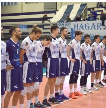
Volley maschile, il VBC Mondovì rinuncia alla Serie A e...