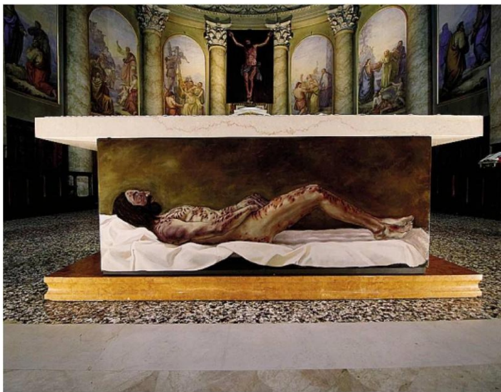
Uno dei dipinti con le ferite di Cristo esposti nella chiesa di Sant'Andrea a Bergamo Alta

considerare appieno la realtà dell'Incarnazione. Quanto alla sede, «sant'Andrea è la chiesa degli studenti dell'Unibg, dell'Istituto di Scienze religiose, di loro attività culturali e artistiche. Quale luogo più ad hoc, anche per favorire l'incontro fra giovani?».