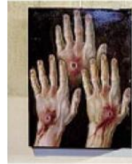
Le mani con i segni della Crocifissione