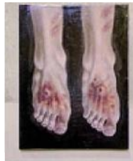
I piedi di Cristo in una delle tele